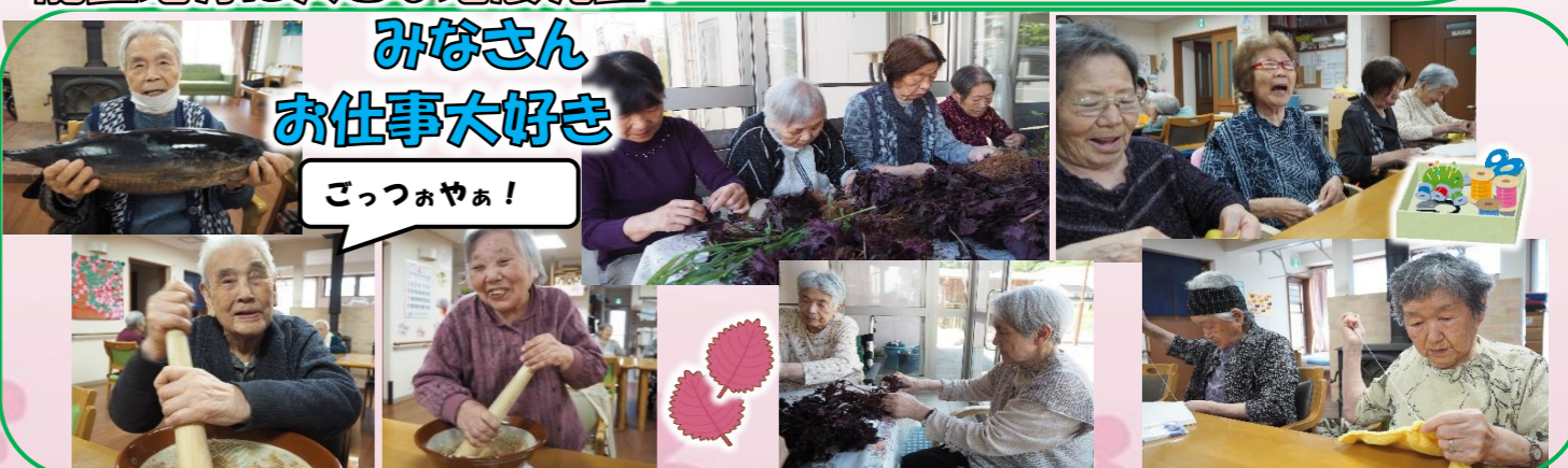
みなさん お仕事大好き