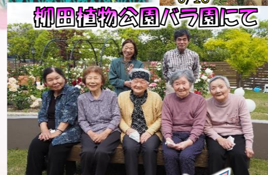
柳田植物公園バラ園にて