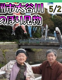
ケアホーム前で鯉のぼり見物