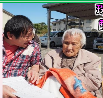
珠洲市大谷川 鯉のぼり見物