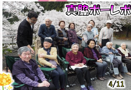
真脇ポーレポーレで花見!